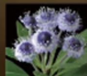
グロブラリア コルジホリアカルス 培養エキス ※1