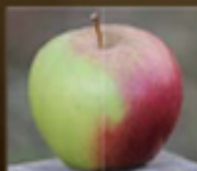
リンゴ果実培養 細胞エキス ※1