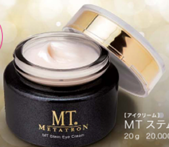
【アイクリーム】 MT ステムアイクリーム 20g 20,000円(税別)