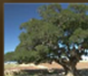
アルガニアスピノサ カルス培養エキス ※1